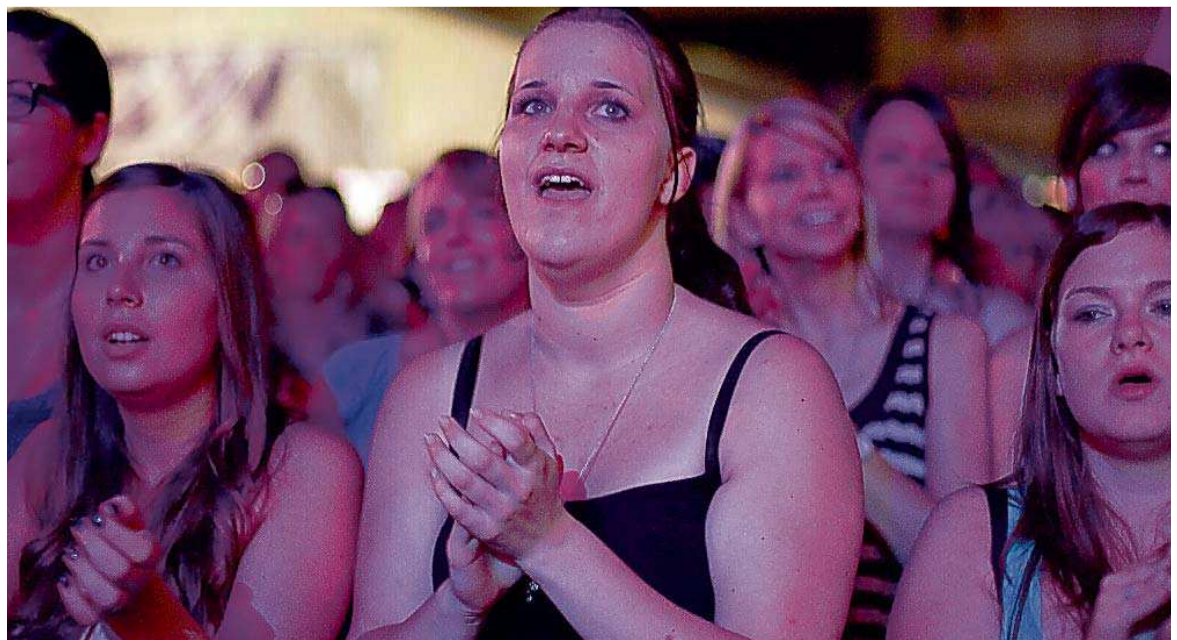
... und seine meist weiblichen Fans fanden am Donnerstag zueinander.