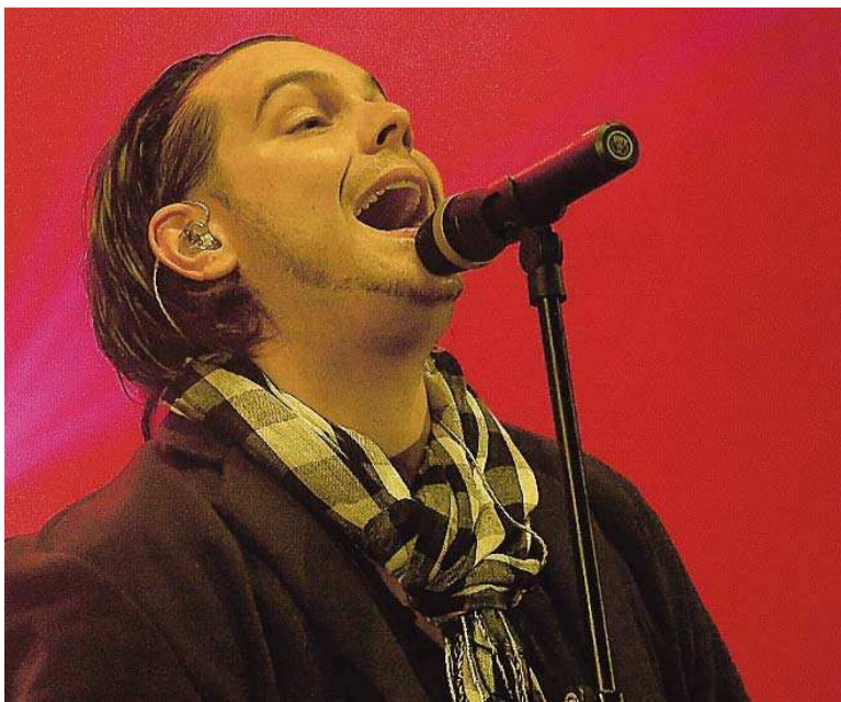
Der Sänger und Songschreiber Nevio ...

punkt, oder besser, für die Schlussnote der Festa 2011 sorgen will.