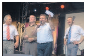
Bei der Eröffnung der Festa sprachen die Ehrgäste italienisch.